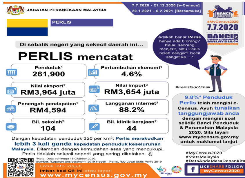
Rajah 2: Data Banci Jumlah Penduduk Negeri Perlis Tahun 2020 hingga tahun 2021